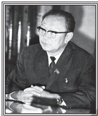
Салчак Калбакхөрекович ТОКА (1901–1973)

Салчак Калбакхөрекович Тока 1901 чылдың декабрь 15-те Таңды-Тываның Каа-Хем кожуунунуң Мергенге төрүттүнген. Бичии чылдарында Дерзиг-Аксының бай орустарынга хөлечиктеп, күш-ажылга дадыккан. Ол 1925–1929 чылдарда Москвага Чөөн чүктүң ажылчы чоннарының коммунистиг университетинге өөренип чораан. 1929 чылдан эгелеп Тыва араттың революстуг намының Төп Комитединиң секретары болбушаан, ТАР-ның культура яамызының албан-дужаалынга дакпырлап ажылдап чораан. 1933 чылдан эгелеп ТАРН ТК-ның чиңгине секретарынга, ооң соонда Тыва Республика ССРЭ-ниң составынга кирген соонда, 1944 чылдан эгелеп чуртталгазының сөөлгү хүннеринге чедир партия тыва Обкомунуң бирги секретары болуп, үзүктел чок ажылдаан. Чымыштыг улуг ажылдарга ажылдап чорза-даа, чогаал бижиир салым-чаяанныг болгаш, чогаал ажылындан салдыкпайн келген.