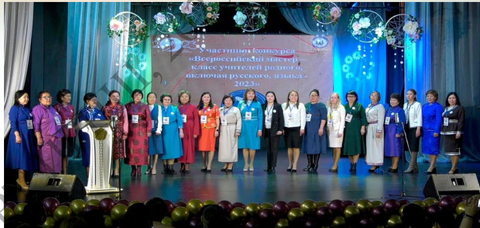
Региональный этап “Всероссийского мастер-класса учителей родного, в том числе русского, языка”