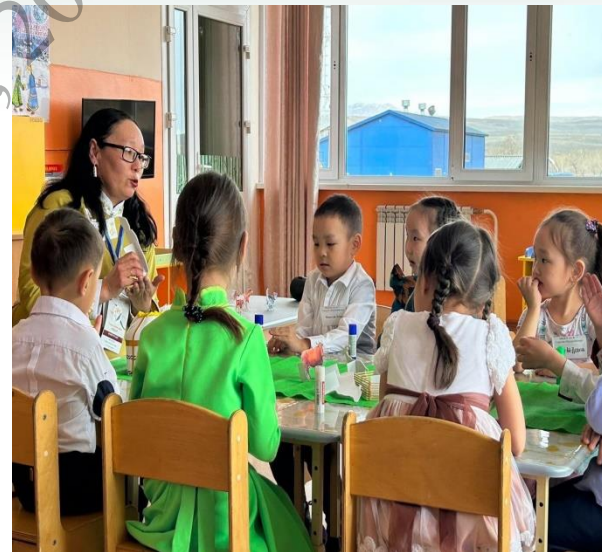
Региональный этап Всероссийского профессионального конкурса «Лучший учитель родного языка и родной литературы» (воспитанники д/с № 17 г. Кызыла)