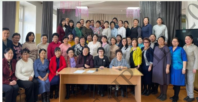
Зональный методический семинар в г. Чадан