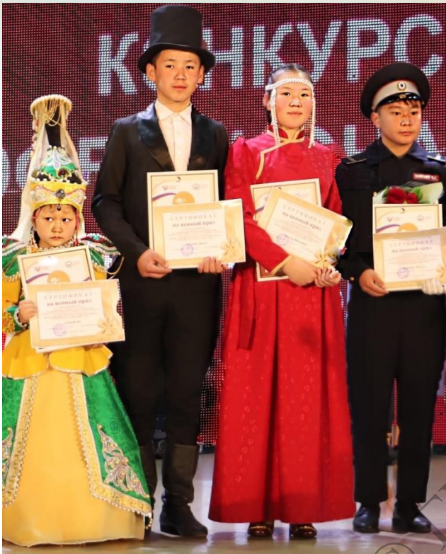
Победители конкурса творчества среди школьников в рамках регионального этапа "Всероссийского мастер-класса учителей родного, в том числе русского, языка"