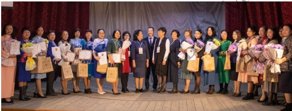
Региональный этап Всероссийского профессионального конкурса “Лучший учитель родного языка и родной литературы”