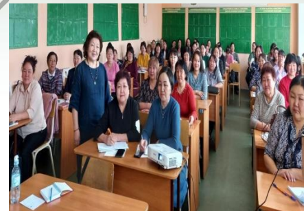
Курс повышения квалификации для учителей родного языка