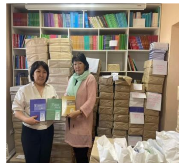
Выдача новых учебников школам