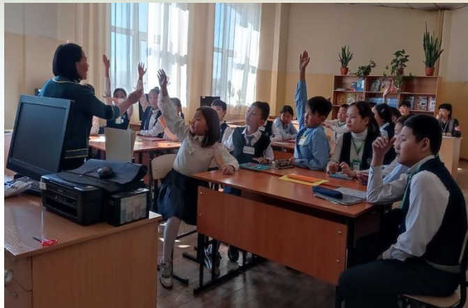
Учащиеся лица № 16. Региональный этап Всероссийского профессионального конкурса «Лучший учитель родного языка и родной литературы»