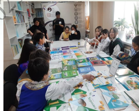
Дни открытых дверей в институте