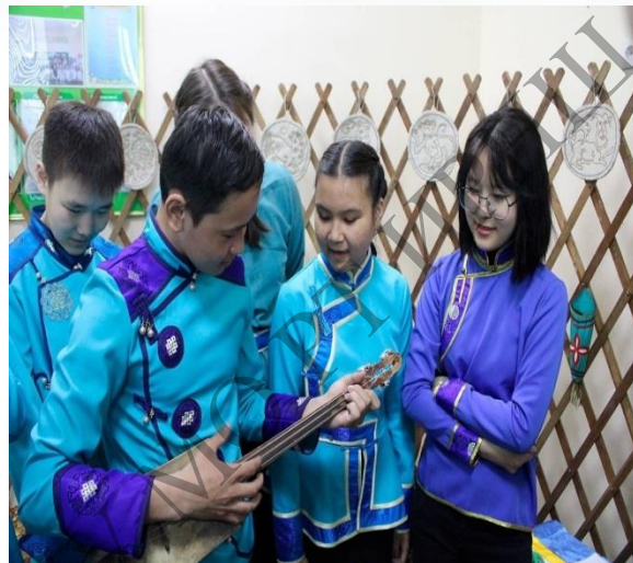
Открытый урок для Первого канала. Лицей № 17 г. Кызыла