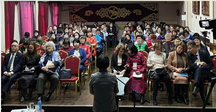
Дискуссионная площадка “Этнокультурное содержание образования”