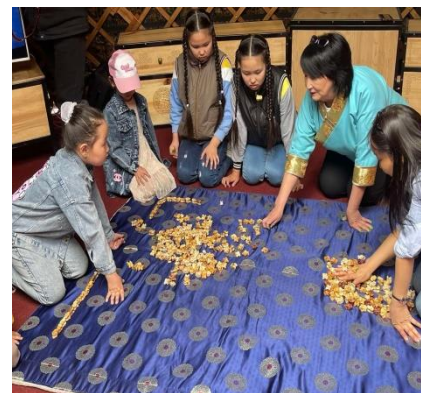
Национальные игры в День защиты детей