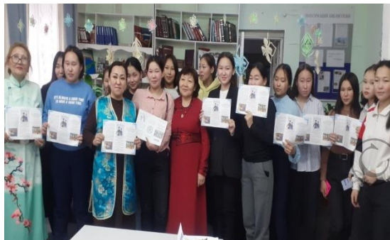
Творческая встреча со студентами сельскохозяйственного техникума