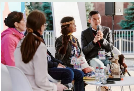
Дискуссия «Региональные языковые центры». Книжный фестиваль «Красная площадь»