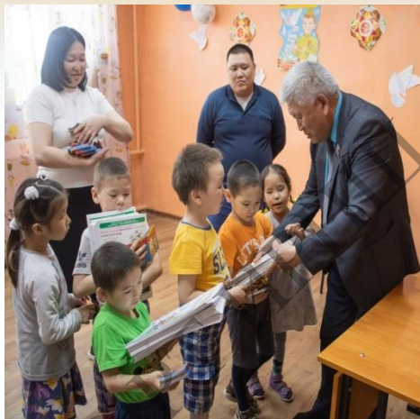
Журнал «Башки» в гостях у детей