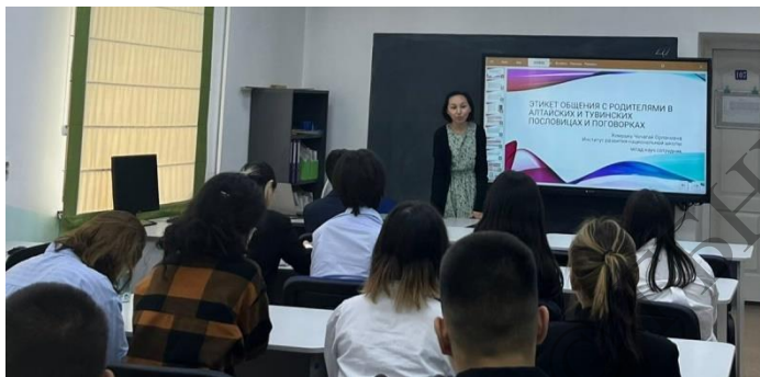
Лекция в акции «Учёные – в школы» Российского общества «Знание»