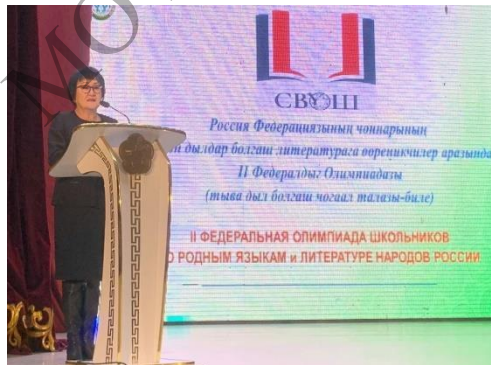
Федеральная олимпиада школьников по родным языкам и литературе